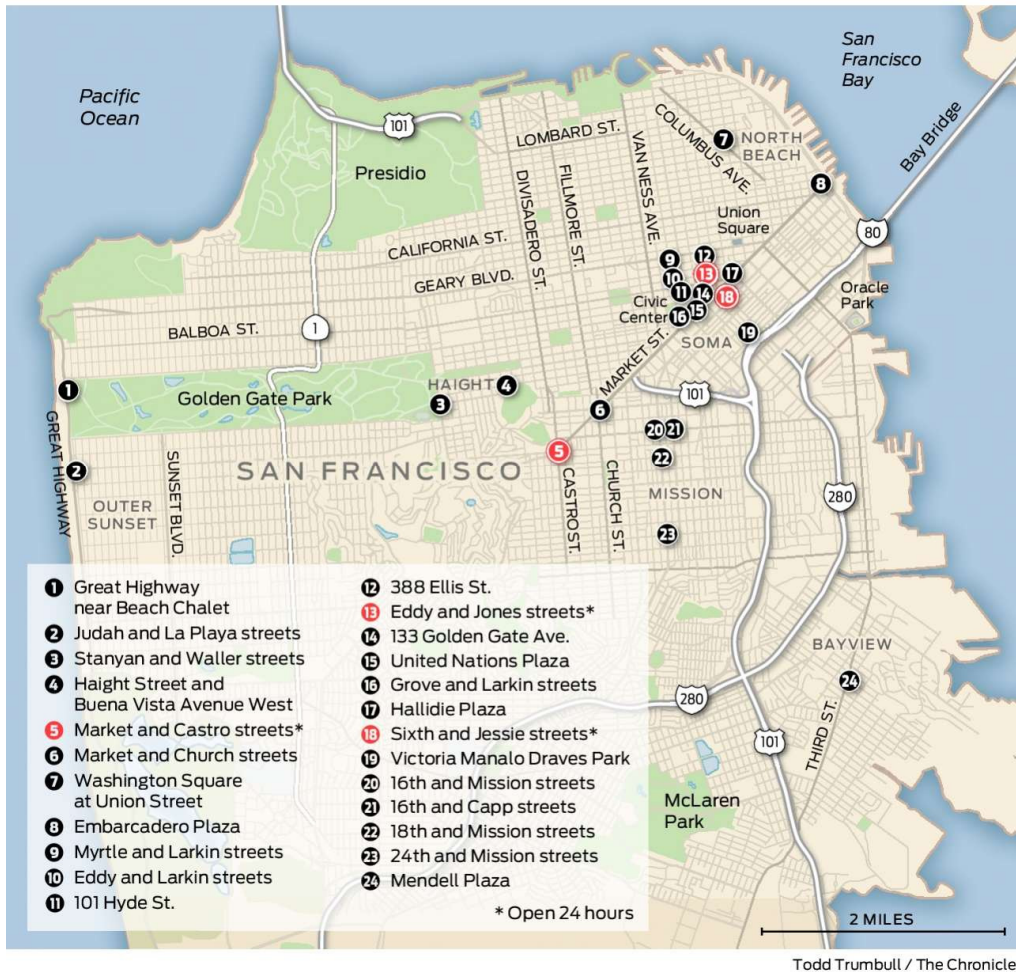
| 그림 3 | 2021년 피트 스톱 배치도 (*빨간 원은 24시간 운영 시설)