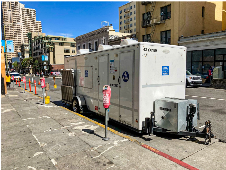
| 그림 2 | 피트 스톱 실제 사진