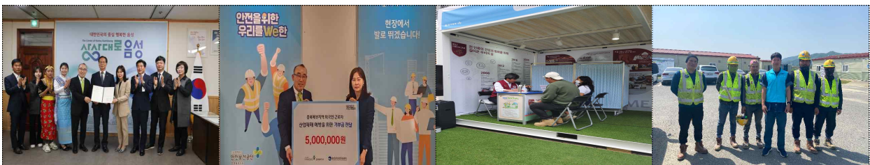
△ 안전보건공단-음성군-외국인지원센터 업무협약 및 외국인근로자를 위한 산업재해예방 성금