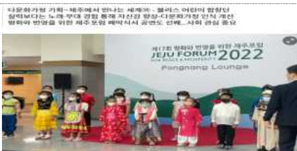
<제주포럼 2022년 공연>