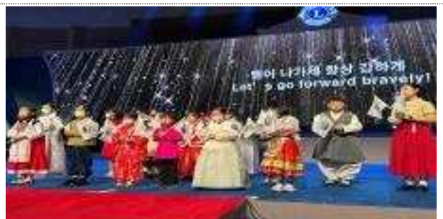
<동남아 라이온스 대회 개막식 축하공연>