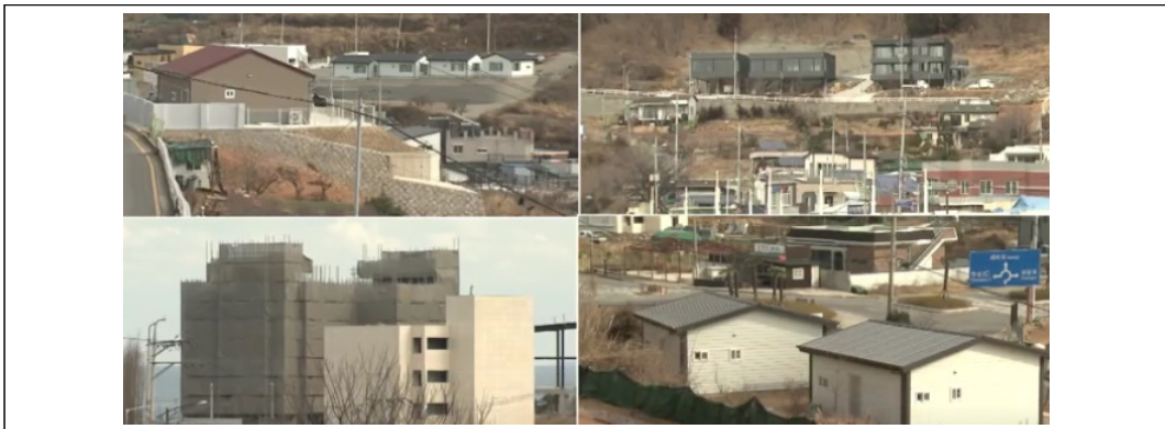
〈그림 2〉 대항마을의 무장소성 현장

Relph(1976)가 자세히 설명하듯이 대개 무장소성은 근대 산업화 시대를 거치며 개발이나 발전에 따라 나타난다. 그래서 곧 소멸할 수도 있는 대항마을에서는 보기 힘든 모습일거라는 예상이 가능하다. 하지만 대항마을에서는 그 어느 때보다도 무장소성이 증가하고 있다. 이는 앞서 ‘마을의 대외적 존재감 향상’에서도 언급했던 동남권 신공항 건설에 따라 보상금을 기대한 투자자들의 무분별하고 획일적 주택 공사가 대표적이고, 또 갑작스럽게 생긴 카페와 같은 상업시설의 영향 때문이다. 난개발로 비춰질 만큼의 장소적 경관 훼손을 넘어 마을 고유의 장소성을 경험할 수 없도록 마을의 지형 자체를 바꿀 정도이다. 이에 대해서는 아래와 같이 지역방송에서도 보도되었고, 본 연구의 현장조사에서도 쉽게 확인할 수 있었다.