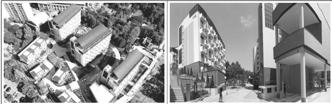
〈그림 1〉 노원에너지제로 주택단지 전경