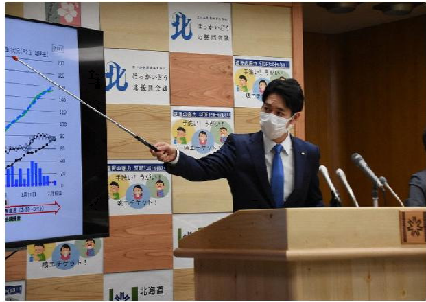
| 그림 2 | 긴급사태선언 효과 설명