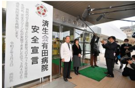
| 그림 5 | 사이세이카이 아리타 병원 안전선언