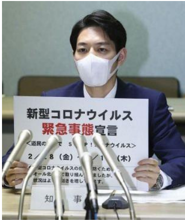
| 그림 1 | 긴급사태선언