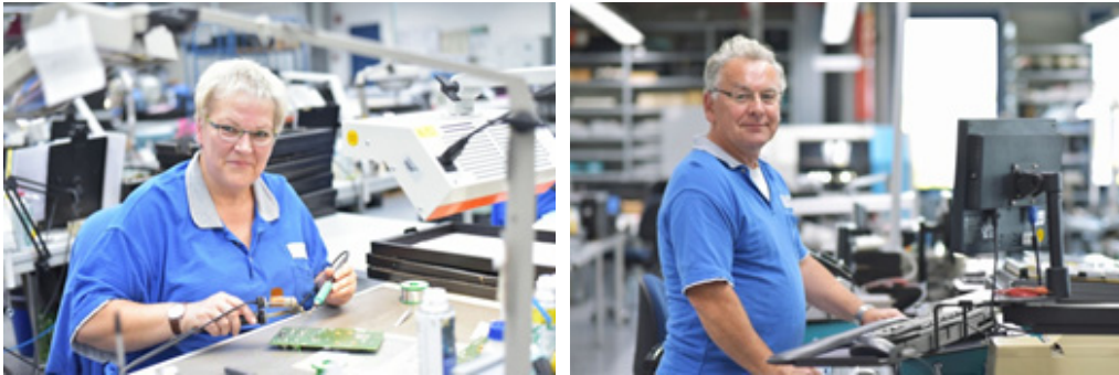
| 그림 1 | waff – Wiener ArbeitnehmerInnen Förderungsfonds