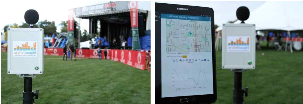
| 그림 1 | 음압 데이터를 수집하는 스마트메뉴 음량 모니터가 설치된 축제 주변