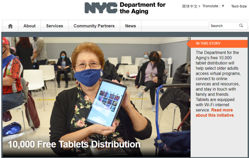
| 그림 2 | 뉴욕 시 노인부 홈페이지