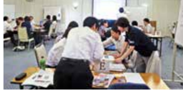
자료: 간사이 광역연합 팸플릿