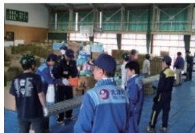
집적소에서의 물자 반출(오즈마치)