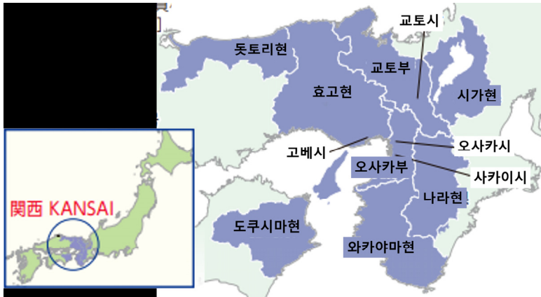
| 그림 1 | 간사이 광역연합 위치도

진흥, 광역 산업 진흥, 광역 구급의료 연계, 환경 대책, 교통·물류기반의 일체적인 운영관리 및 ‘광역행정을 전개’하고자 함