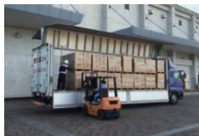
지원 물자 반송